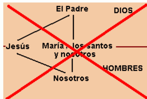
B. Interpretación herética

Analicemos primero la figura B de la intercesión. Quizás esta sea tu idea de la