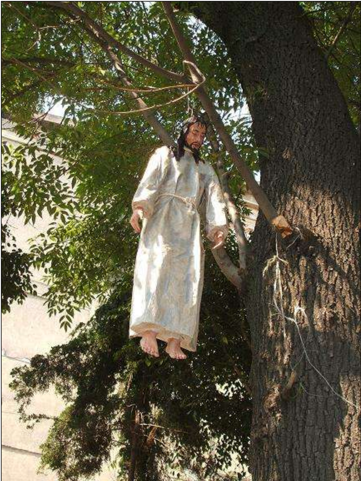
Calvario y escenas de la Pasión