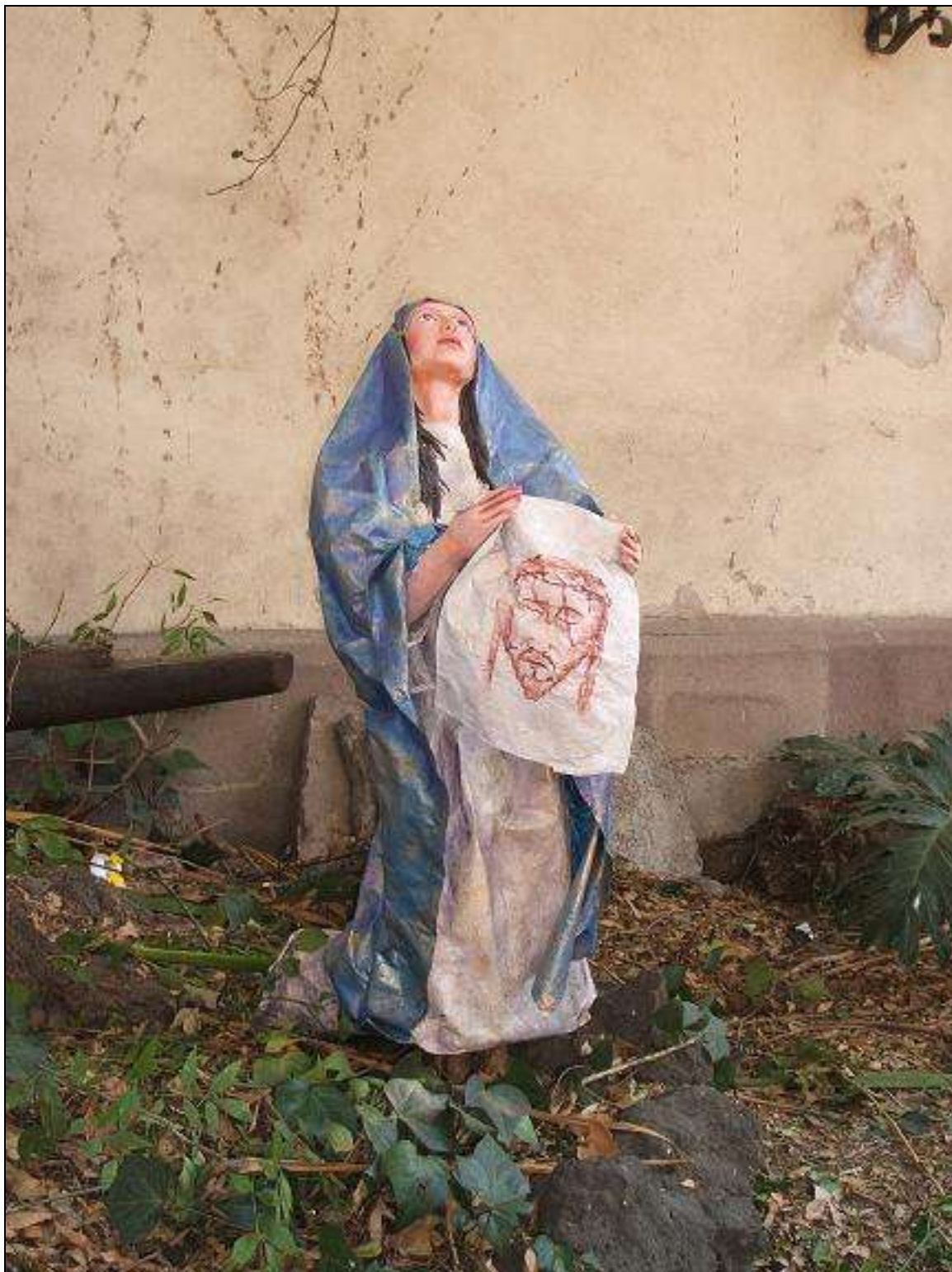
Calvario y escenas de la Pasión Parroquia de San Cosme