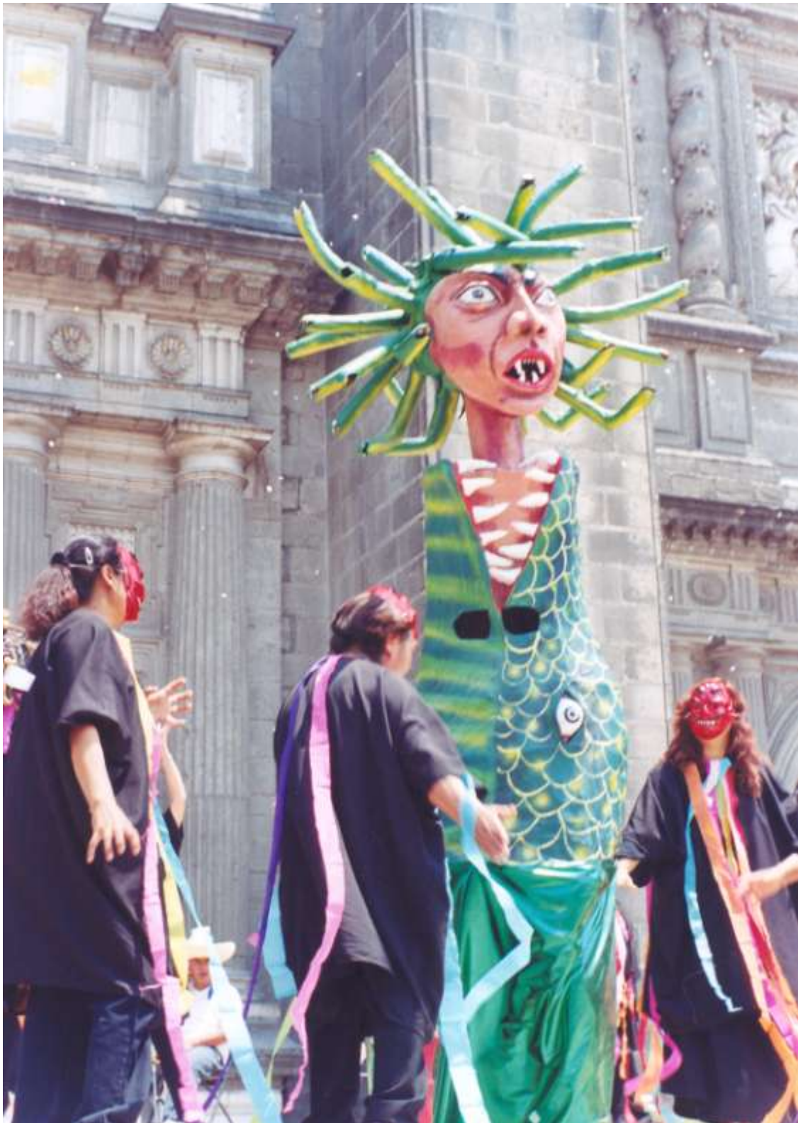
Representación de La Envidia