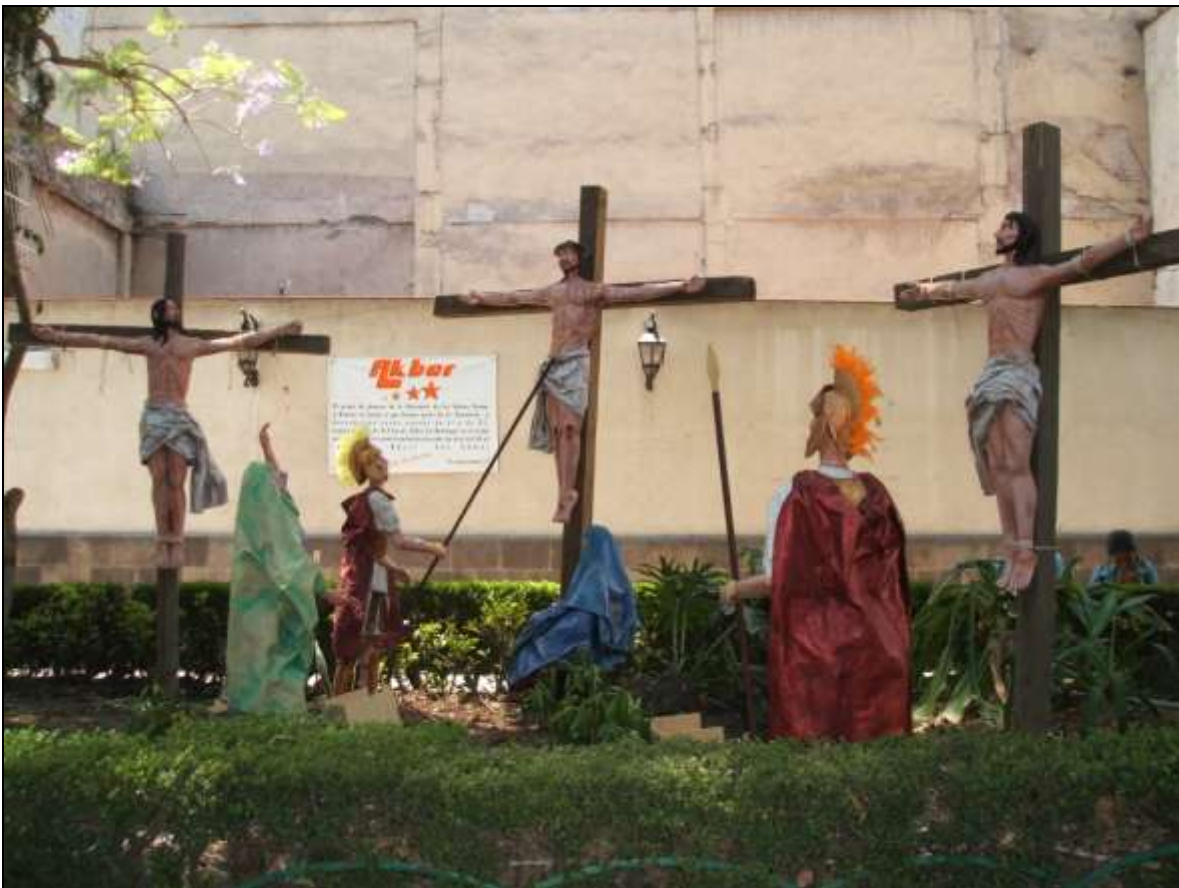
Calvario y escenas de la Pasión Parroquia de San Cosme